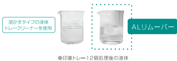
●印象トレード12個処理後の液体