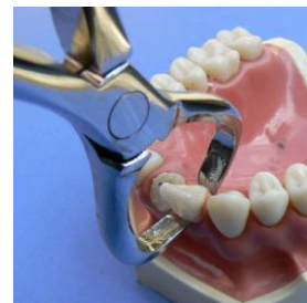
図3 #1で継続歯を除去