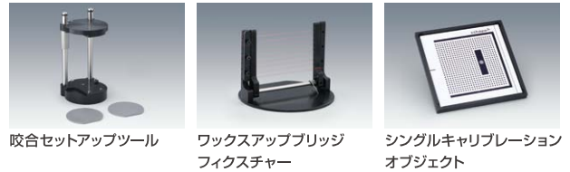
咬合セットアップツール