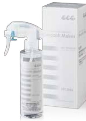
スムーズメーカー 歯科印象用滑沢剤 200gボトル