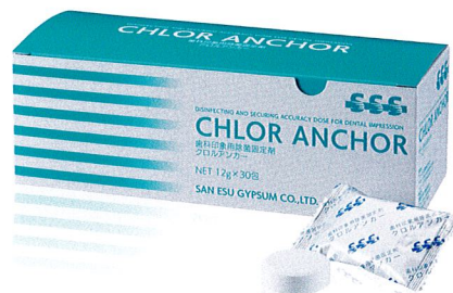
クロルアンカー 歯科印象用除菌固定剤 錠剤 12g×30包/箱