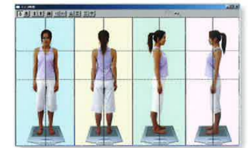
静止画像取り込み機能 オプション