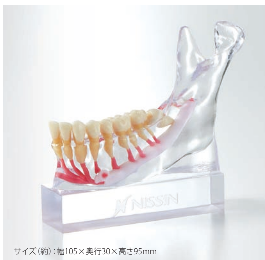
サイズ(約):幅105×奥行30×高さ95mm