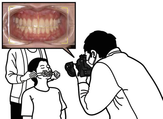
フォトガイドー A 装着図