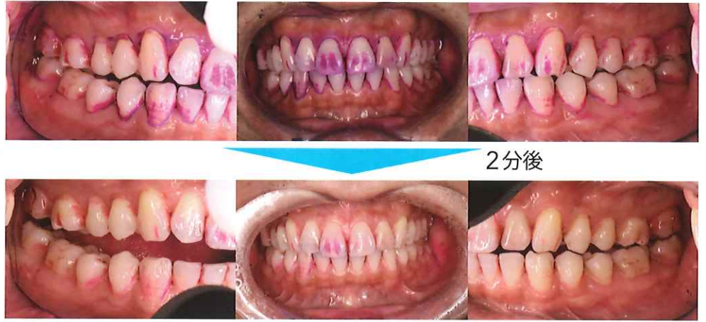
右側が一般的な歯ブラシ 左側がionic歯ブラシ(スリムヘッド)使用