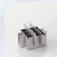
バスケット仕切り板