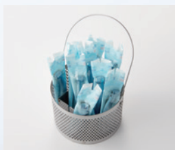
滅菌バッグに入れたハンドピース 9本を収容した状態