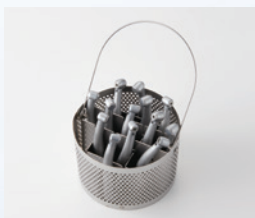
未包装ハンドピース13本を 収容した状態

未包装ハンドピースを最大13本まで滅菌可能な大容量の滅菌チャンバーを装備。滅菌バッグに入れたハンドピースなら最大9本まで滅菌することができます。