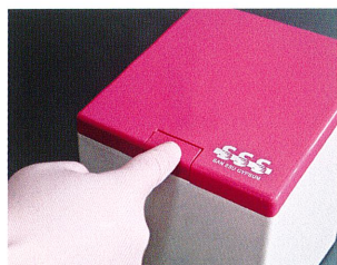
ワンタッチオープン