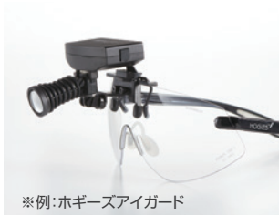
※例：ホギーズアイガード