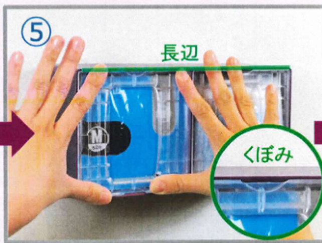
⑤ 蓋を押してしっかりとセットします。この時、蓋のくぼみがディスペンサーの長辺側になるようにセットしてください。