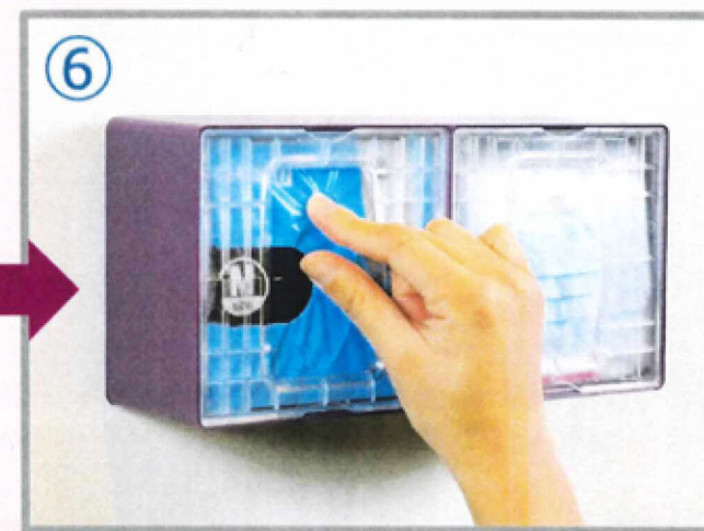
⑥ ミシン目にそって取り出し口を開けます。