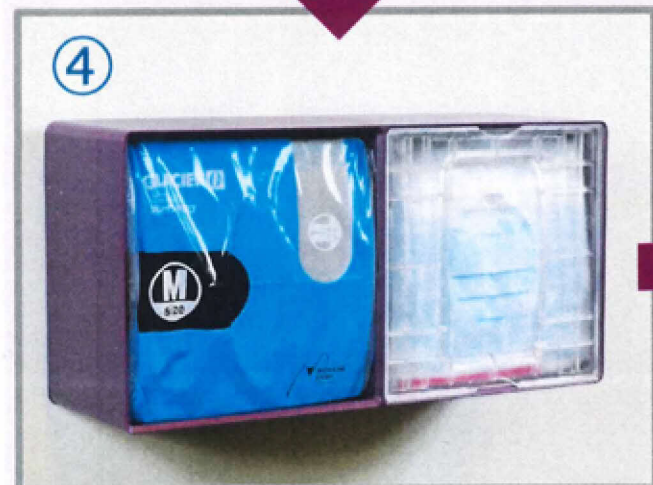
④ パネを押し込みながらグローブをセットします。