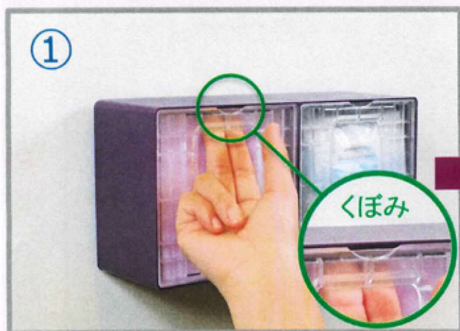
① 蓋のくぼみの裏側にディスペンサー内部から図①のように指先をかけます。