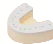
だいちゃん全額用