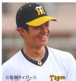
ANGLE契約選手 阪神タイガース所属 中野 拓夢 (プロ野球選手) 2021年 盗塁王 2021年 歴代最高盗塁成功率記録 2021年 セリーグ連盟新人特別賞受賞