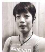
入部 正太郎 プロロードレース選手