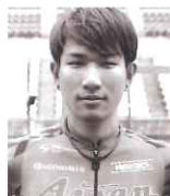
草場 啓吾 プロロードレース選手