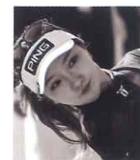
西山 奏 女子ゴルファー