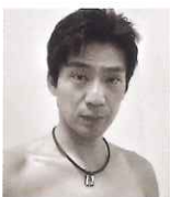
池谷 直樹 元体操選手・スポーツタレント