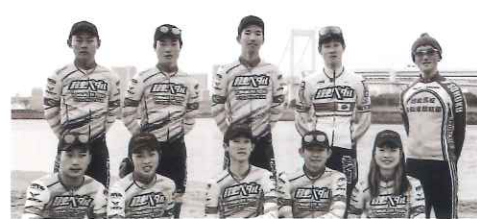
弱虫ベダ ルサイクリン グチーム プロロードレ ースチーム