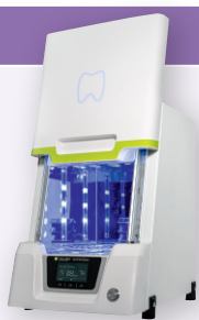
カーラ プリント LED キュア 光重合器