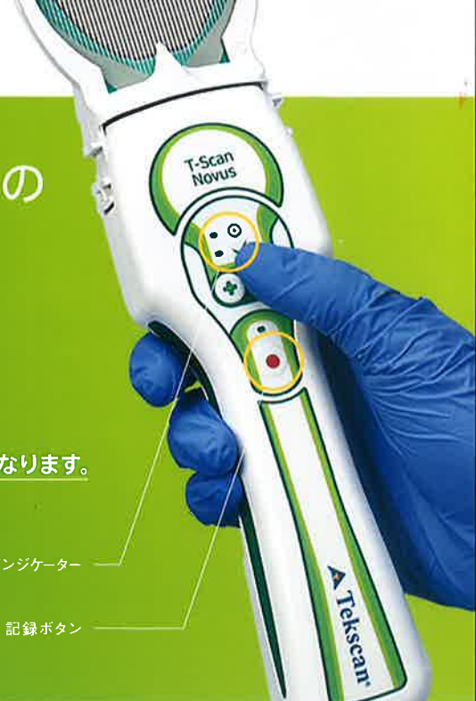
センサインジケター

これより、科学的で客観的なデータに基づいた咬合診断、治療結果の判定が可能となります。