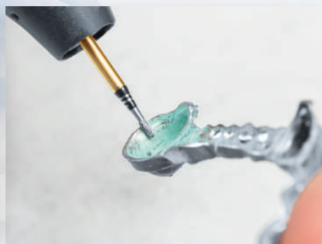
H73SHAX-014 クラウンの内面修正